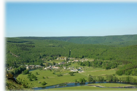
Tournavaux, au bord de la Semoy

Pour les enfants dont les familles ne pourront se déplacer dans les Ardennes, nous proposons cette année un hébergement à l'Auberge des Chenets à Tournavaux (site internet au verso). Riche d'une longue histoire, ce lieu offre des prestations exceptionnelles en terme de confort, de convivialité et d'environnement paysager. 155€/enfant, nourriture comprise.